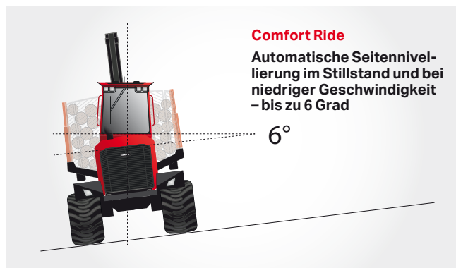
Beim Be- und Entladen aufrecht sitzen – auch bei Neigungen von bis zu 6 Grad